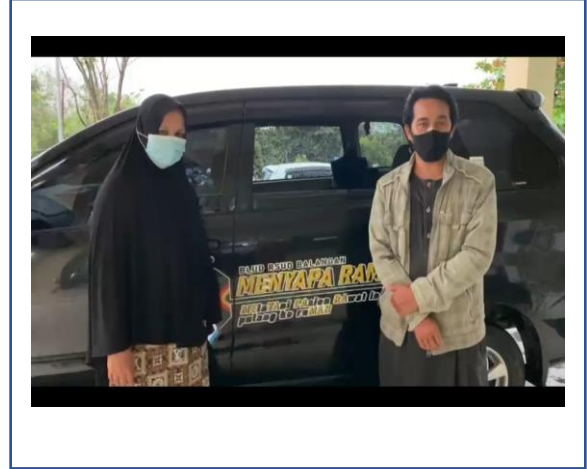
Pulang tanggal 28 Februari 2023